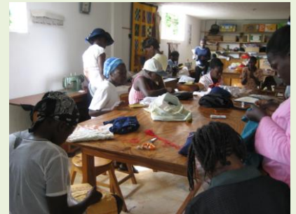
Unterrichtalltag in der Näherschule..