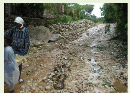
Starke Regenfälle überschwemmten die Durchgangsstraße vor der Schule in Meyer.