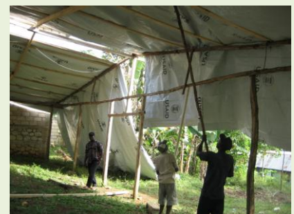
Wiederaufbau der provisorischen Schule nach einem Hurrikan.