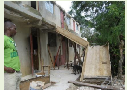
Wiederaufbau der Treppe am Hauptgebäude in Meyer.

Mit Gottes Hilfe und Dank Eurer liebevollen und zahlreichen Spenden sind wir guten Mutes, dass alles wieder aufgebaut werden kann.