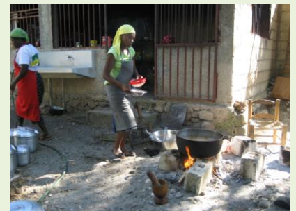
Kochen für die Kinderspeisung in Meyer.