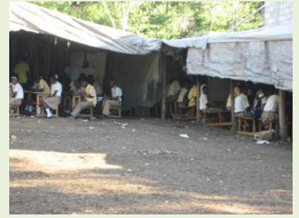
Lernen und Prüfungsarbeiten unter erschwerten Bedingungen.